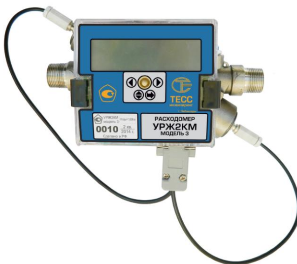
Рисунок 1 - Общий вид расходомера УРЖ2КМ Модель 3 (DN 20)